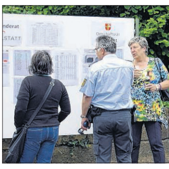
Die Ergebnisse wurden im Rathaus ausgehängt und reichlich diskutiert.

Spannend wird in der Gemeinde Willstätt die Wahl der Ortsvorsteher. Mögliche Kandidaten für das Amt des Ortsvorstehers für die scheidenden Rathauschefs in Eckartsweier, Hesselhurst und Sand sowie auch Amtsinhaber stehen in den Startlöchern.